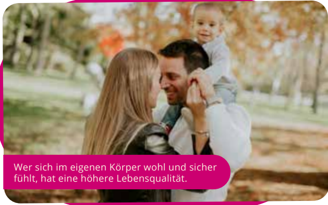
Wer sich im eigenen Körper wohl und sicher fühlt, hat eine höhere Lebensqualität.

der Laserbehandlung werden aber auch mehr Kollagenfasern im Bereich der Harnröhrenöffnung und der vorderen Vaginalwand gebildet. Auf diese Weise wird die Harnröhre in ihrer Funktion unterstützt und die Inkontinenz behandelt. Die Erfolgsquote ist hoch: Studien attestieren rund 70 Prozent aller Frauen bereits zwölf Wochen nach Abschluss der Behandlung keinen unfreiwilligen Harnverlust mehr. Die Expertin für plastische Gynäkologie empfiehlt drei bis vier dieser halb-stündigen, schmerz- und nebenwirkungsfreien Behandlungen mit dem Hightech-Laser.